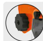
Perilla para ajuste