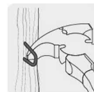
Uña para remover grapas