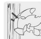
Tenaza para remover grapas