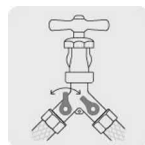
Válvulas de cierre de 1/4" de vuelta