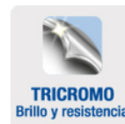
TRICROMO Brillo y resistencia