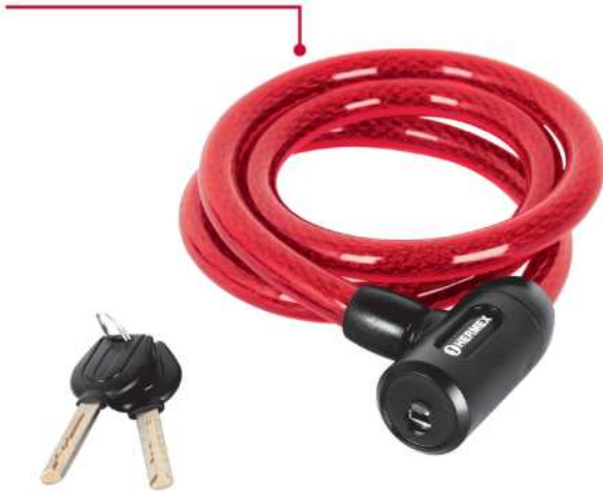
Cable de acero trenzado