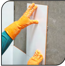
Cerámica y Azulejo