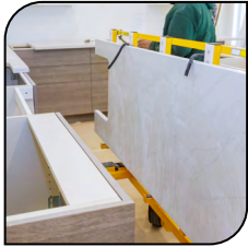
Piedra y Marmol