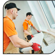
Hormigón y Mampostería