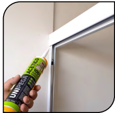
Box de Baño

Sellador de silicona monocomponente de curado acetico indicado para el sellado de aluminio, vidrio, azulejo, cerámica, sanitarios y box de baños. Resistente a la formación de hongos. Con propiedades de no escurrimiento, cura con la humedad ambiente, formando un caucho flexible y durable.