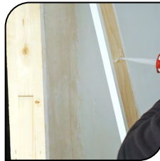
Acabado de Puerta