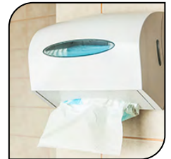
Soporte de Papel