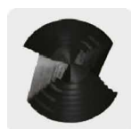
Punta Split Point