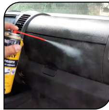
Panel de Automovil