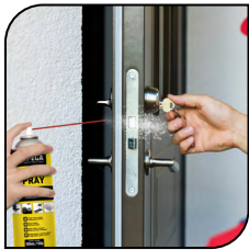
Cerradura de Puerta