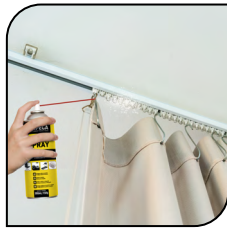
Riel de Cortina