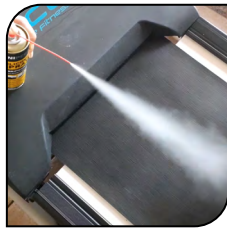
Cinta de correr de gimnasio