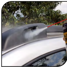
Piezas de plástico