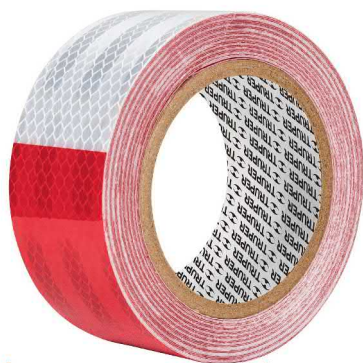
Ancho 50 mm (2")