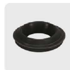
Empaque cónico antifuga